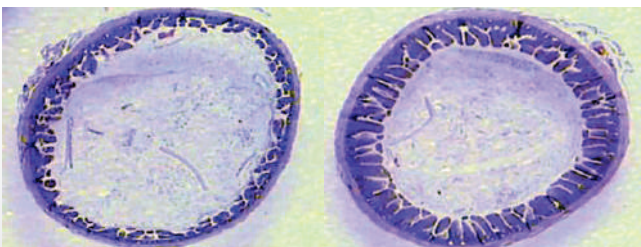
Figura 3 - Sin FloraMax® B11

Modulación de la microflora después de la eclosión favorece el desarrollo intestinal. El desarrollo óptimo del sistema digestivo de las aves recién nacidas depende de una implantación de la población microbiana de manera equilibrada. La administración de probióticos acelera el desarrollo del tracto gastrointestinal. Las figuras 1 y 2 comparan el íleon aves de corral histológico con tres días de edad con o sin el tratamiento con un probiótico. Las imágenes muestran un mejor desarrollo de la mucosa intestinal en las aves tratadas.